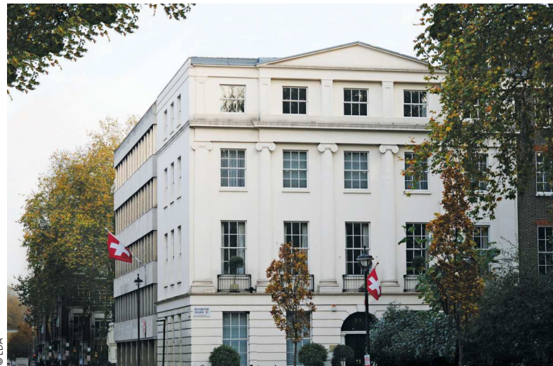
Schweizer Botschaft in London / Ambassade de Suisse à Londres

Schweizer Botschafter im Vereinigten Königreich Ambassadeur de Suisse au Royaume-Uni